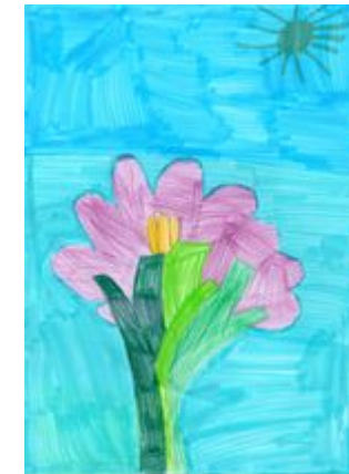
"Κρόκος ο κυπριακός" Ζωγραφιά από τον μαθητή της Στ΄1 Μάριο Τζιωνή.