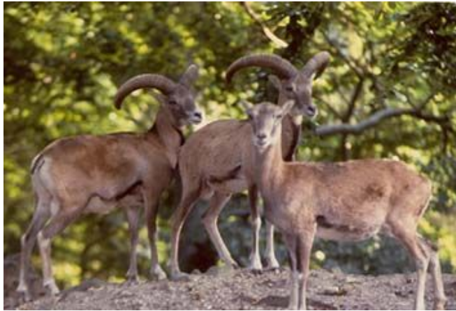
Κείμενο: Μαρίλια Ιωάννου, Στ΄ 2

Το αγρινό είναι ενδημικό είδος άγριου προβάτου που ζει στα δάση της Κύπρου και κυρίως στον Σταυρό της Ψώκας (περιοχή Δάσους Πάφου).