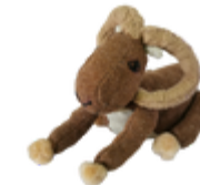
Ο Ερασιμούλης Αγρινούλης, η μασκότ του σχολείου μας