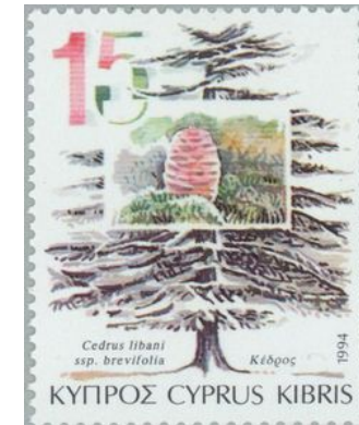
"Κέδρο" Απεικόνιση σε γραμματόσημο.